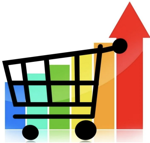
Розничная торговля Упрощение условий для предпринимателей

Успешная реализация ОРВ продемонстрирована в различных сферах. Например, при разработке нормативов благоустройства, правил торговли на улицах, требований к размещению объектов розничной торговли. ОРВ помогает выявить лишние барьеры, упростить процедуры и повысить привлекательность для предпринимателей.