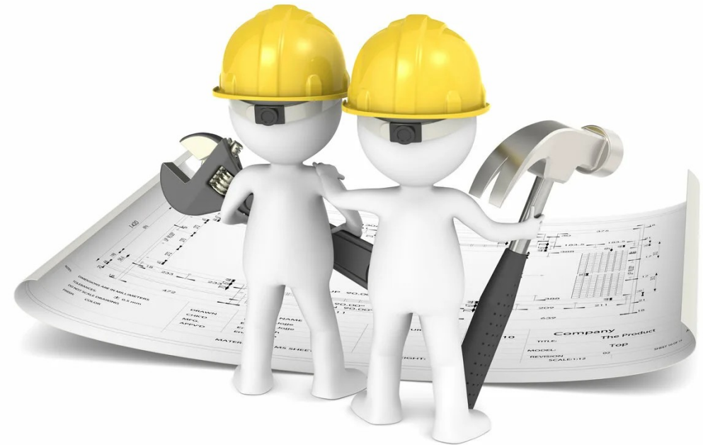
Строительство и услуги Снижение административных барьеров